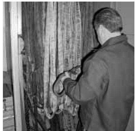
Figura 8: controllo degli accessori di imbracatura da parte di una persona qualificata.