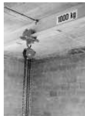
Figura 4: indicazione chiara e leggibile della portata massima del carrello.