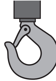
Figura 1: gancio con dispositivo di sicurezza.