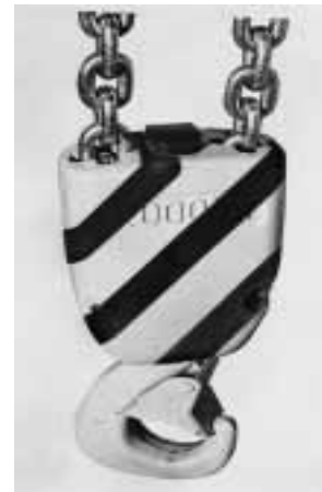
Figura 2: bozzello dotato di una protezione nel punto di imbocco della catena.