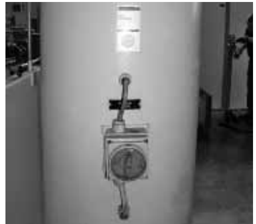
Figura 7: interruttore generale della gru disinserito e bloccato con un lucchetto per evitare che possa essere azionato accidentalmente.