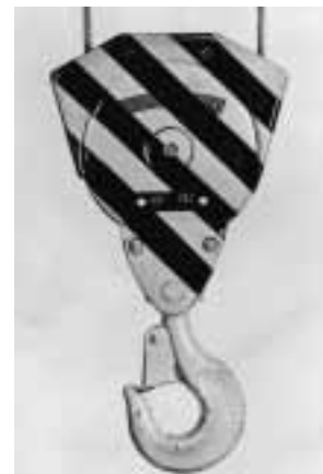
Figura 3: puleggia con protezione nel punto di imbocco.